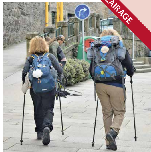
Les motivations des pèlerins sont toujours très diverses.

Le culte des reliques est un des éléments les plus importants de la pratique religieuse au Moyen Âge. Mais il serait faux d'imaginer que tous se mettent en route pour de lointaines destinations comme la Terre Sainte. Pour partir, il faut de l'argent et du temps: «Il s'agit d'une aventure très longue, très coûteuse et très périlleuse, si bien que ceux qui la tentent ne sont en fin de compte qu'une minorité.» 11 Le peuple ne peut s'absenter pour de longs mois sans générer de revenus. Il existe cependant de nombreux sanctuaires locaux, comme par