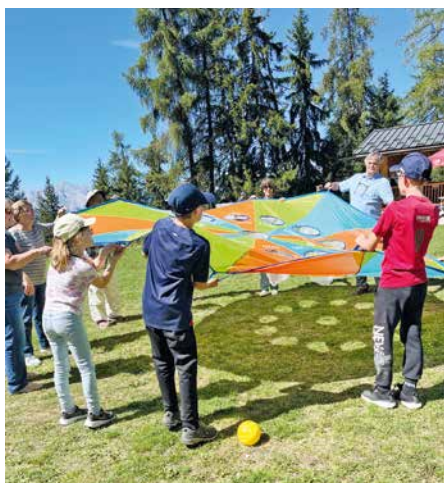
Jeux d'adresse (la grande toile et la tour).