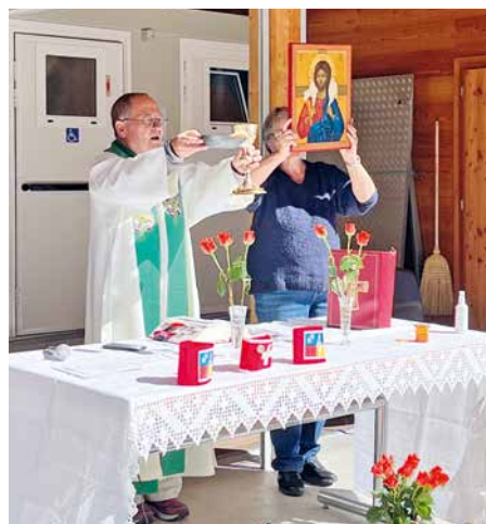
Messe en plein air.