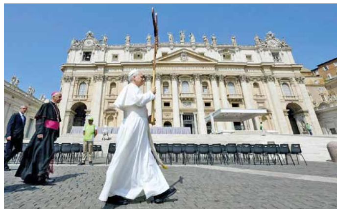
Léon a continué l'année jubilaire, marchant dans les pas de François.

Marchant dans les pas de François, Léon a continué l'année jubilaire en présidant les diverses messes de jubilé : des Eglises catholiques orientales, des familles, des mouvements d'Eglise, du Saint-Siège, des sportifs... Reprenant tel quel le programme