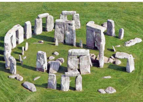
Le site de Stonehenge était, au néolithique déjà, un lieu où l'on se rendait pour vivre une expérience spirituelle.

est qu'il est libre et volontaire. Partir n'est certes pas toujours un choix. Il y a eu à certaines périodes des pèlerinages pénitentiels imposés par les confesseurs ou les tribunaux. Cependant, il n'y a jamais eu d'obligation générale à tous les fidèles, contrairement à certaines époques du Judaïsme ou à l'Islam.