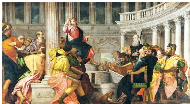
Jésus enseignant au Temple.

Cette escapade et ce déplacement dans le Temple anticipent l'exode du Fils de Dieu vers celui qui l'a envoyé et aux affaires duquel il doit d'ores et déjà s'adonner. Il plante une première écharde dans le cœur de Marie qui lui fait des reproches, remplie d'émotion et d'angoisse. Sa mère sera encore là lorsqu'une nouvelle épée sera enfoncée dans son être, au Golgotha. La mort sur la croix ouvre au voyage définitif vers le Seigneur par la Résurrection d'entre les morts.