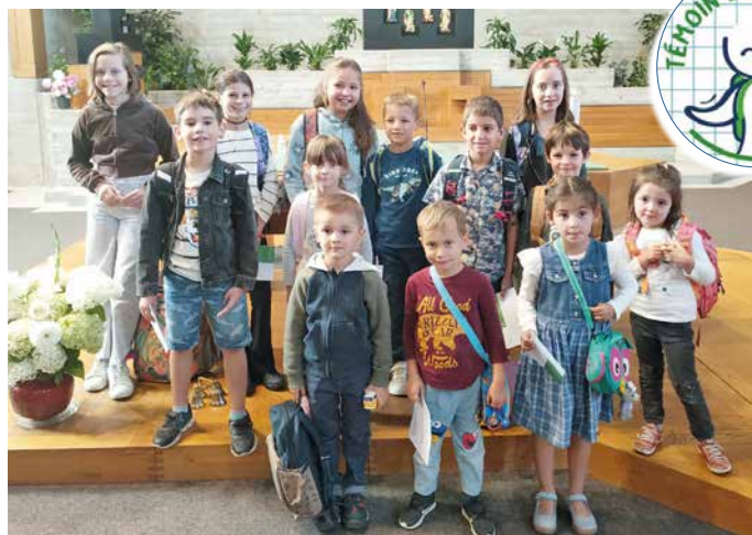
Les enfants présents à la bénédiction.