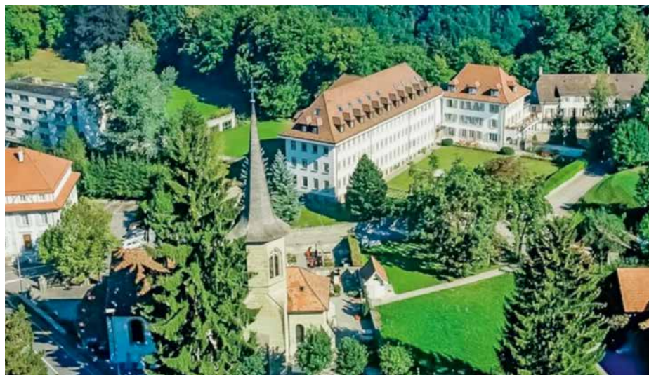
Bourguillon, dans le canton de Fribourg, est un sanctuaire prisé par les pèlerins.

L'espace manque malheureusement pour continuer à conter la riche et passionnante histoire des pèlerinages. Mais que cela ne vous retienne pas de chausser vos meilleurs souliers, la Suisse regorge de lieux magnifiques: Einsiedeln, l'hospice du Grand-Saint-Bernard, l'église de Siviriez, l'ermitage de Longeborgne, le Ranft... n'attendent que vous.