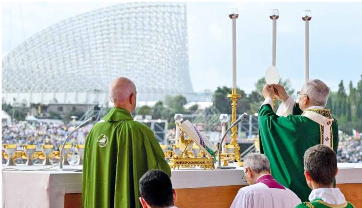
La messe de clôture du Jubilé des Jeunes à Tor Vergata a rassemblé plus d'un million de participants.

L'année du Jubilé est sur le point de prendre fin (14 décembre 2025). Beaucoup auront eu la chance de se rendre en pèlerinage à Rome. C'est l'occasion de nous pencher sur les démarches de pèlerinage à travers leur histoire et l'influence qu'elles ont exercée.