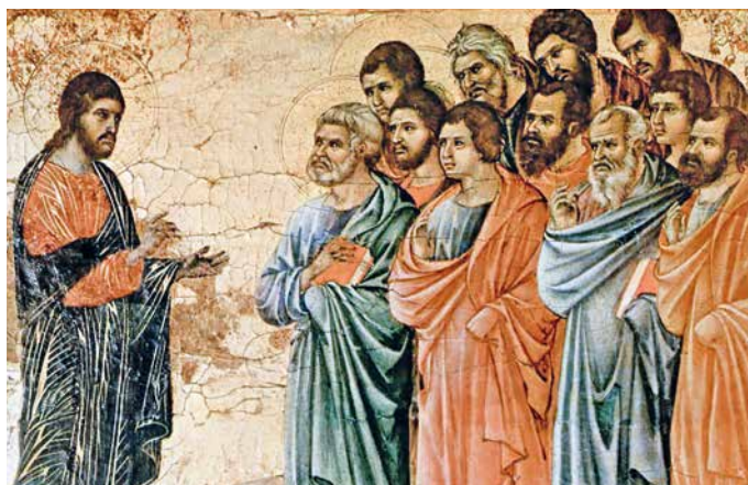
Nous sommes invités à nous placer à côté de ces personnages de l'Evangile qui s'approchent du Fils de l'homme en mettant leur confiance en lui.

Lorsque le papa amène l'enfant captif de ce mal depuis l'enfance, il avance avec précaution : « Si tu peux nous venir en aide et nous prendre en pitié. » « Rien n'est impossible à celui qui croit », réplique Jésus. Et alors l'homme prononce cette phrase que nous sommes