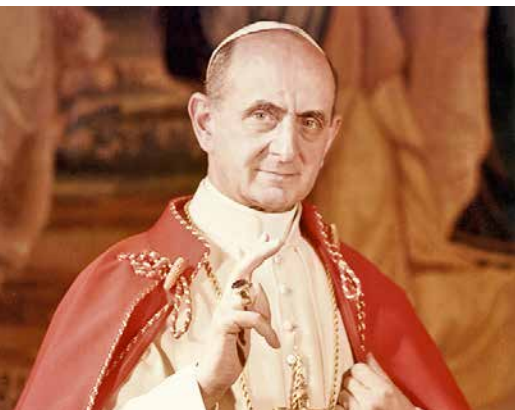
Paul VI, en 1968, a écrit son propre credo. Il n'est pas le seul Pape à avoir procédé de la sorte.