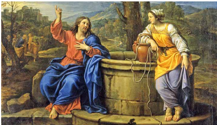
Dans les Évangiles, les Samaritains tiennent une bonne place dans l'art de professer leur foi en Jésus Messie et Fils de Dieu. Le dialogue avec la Samaritaine en atteste.

« Dis-moi comment tu crois, je te dirai qui est ton Dieu. » Une façon d'inviter la foule de demandeurs de sacrements – appelés catéchumènes – à exprimer leur propre credo tout en décortiquant les deux officiels, celui de Nicée-Constantinople et le Symbole des Apôtres. Et leur relecture ne corrobore pas toujours la doctrine officielle. Mais les comprend-on vraiment bien dans le détail ?