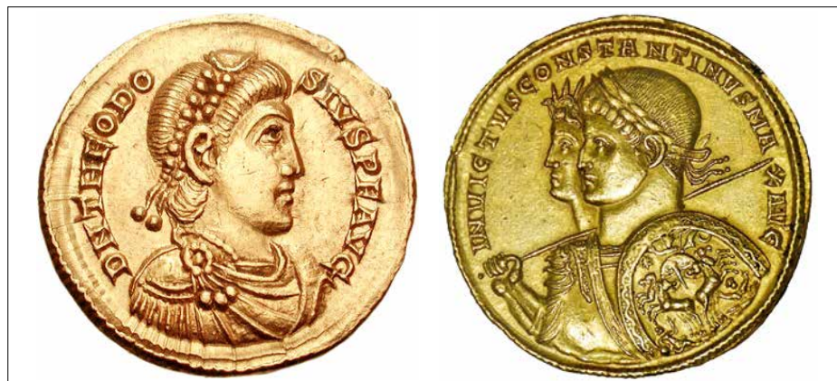
Constantin (à droite) a convoqué le concile de Nicée en 325. Theodose (à gauche) convoquera celui de Constantinople en 381.

Je crois en un seul Dieu, le Père tout puissant, créateur du ciel et de la terre, de l'univers visible et invisible, Je crois en un seul Seigneur, Jésus Christ, le Fils unique de Dieu, né du Père avant tous les siècles : Il est Dieu, né de Dieu, lumière, née de la lumière, vrai Dieu, né du vrai Dieu Engendré non pas créé, consubstantiel au Père ; et par lui tout a été fait. Pour nous les hommes, et pour notre salut, il descendit du ciel ; Par l'Esprit Saint, il a pris chair de la Vierge Marie, et s'est fait homme. Crucifié pour nous sous Ponce Pilate, Il souffrit sa passion et fut mis au tombeau. Il ressuscita le troisième jour, conformément aux Ecritures, et il monta au ciel ; il est assis à la droite du Père. Il reviendra dans la gloire, pour juger les vivants et les morts et son règne n'aura pas de fin. Je crois en l'Esprit Saint, qui est Seigneur et qui donne la vie ; il procède du Père et du Fils. Avec le Père et le Fils, il reçoit même adoration et même gloire ; il a parlé par les prophètes. Je crois en l'Eglise, une, sainte, catholique et apostolique. Je reconnais un seul baptême pour le pardon des péchés. J'attends la résurrection des morts, et la vie du monde à venir. Amen.